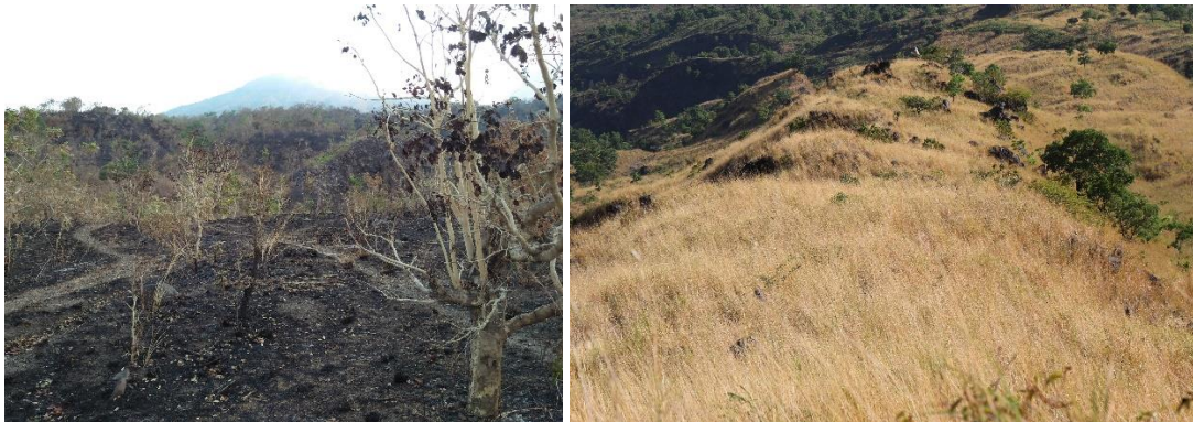
Gambar 2 Kebakaran pada tahun 2019 di Hutan Desa Dukuh (kiri), area yang terus terbakar tutupan pohonnya berkurang dan didominasi oleh rumput (kanan).

Hutan Desa Dukuh adalah hutan lindung seluas 455 ha yang kini dikelola oleh Lembaga Pengelola Hutan Desa (LPHD) Anugrah Wisesa dalam skema Perhutanan Sosial, dengan dampingan dari Conservation International (CI) Indonesia. Hutan ini terletak di Kecamatan Kubu, Kabupaten Karangasem, Bali. Dengan curah hujan 500 – 1000 mm per tahun, wilayah ini merupakan yang terkering di pulau Bali.